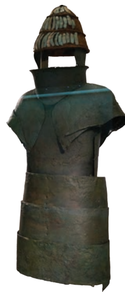
Микенски војнички оклоп

Подсети се како називамо облик државног уређења у којем један човек (нпр. краљ) има водећу улогу.