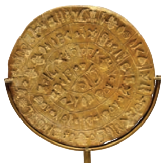
Чувени диск из Фестоса са натписом на критском хијероглифском писму