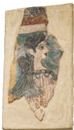
Приказ жене на критској фресци

Шта уочаваш на предњем делу Миносове палате у Кнососу?