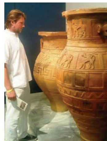
Вазе и ћупови за складиштење намирница, палата у Кнососу

Једно од обележја критске културе су велелепне палате . Оне су биле средиште друштвеног живота. Имале су водовод и канализацију, док су њихови унутрашњи зидови били осликани фрескама . Свака од њих је имала двориште у којем су се одржавале свечаности. Око палата су се развијала насеља која су често имала и поплочане улице.