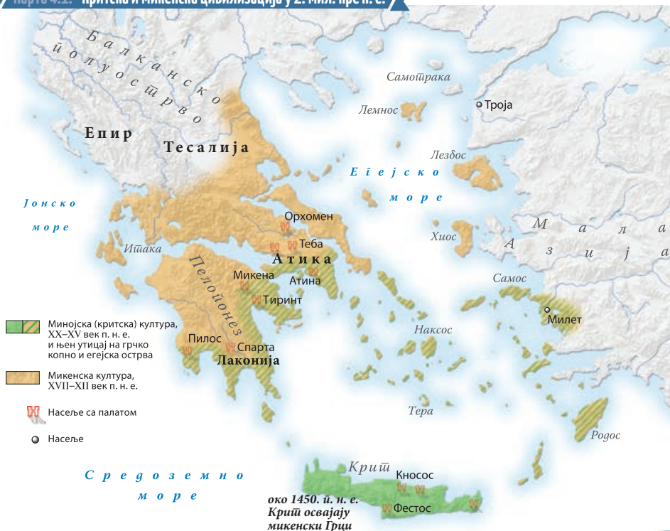
Карта 4.1: Критска и микенска цивилизација у 2. мил. пре н. е.

Покажи на карти најважније цивилизације античке Грчке. На који начин је географски положај Крита могао да утиче на развој његове трговине?